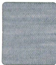
NZ001 LIGHT GRAY

雄大な大自然の中で育った ニュージーランドメリノは光沢と白度に富み、 大きな湾曲のクリンプ(捲縮)形状により 豊かな嵩高性と非常にソフトで 上質なヌメリ感のある風合いとなります。