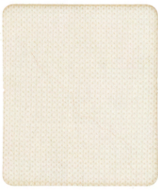
960001 WHITE (萤光晒)