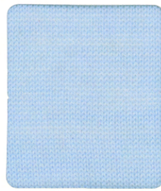
960701 BABY BLUE