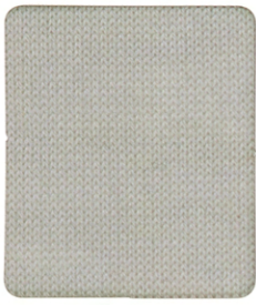
130903 SMOKE GRAY