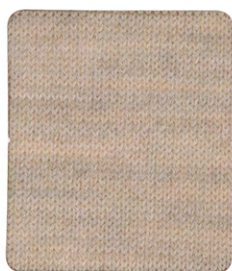
NZ004 LIGHT BEIGE